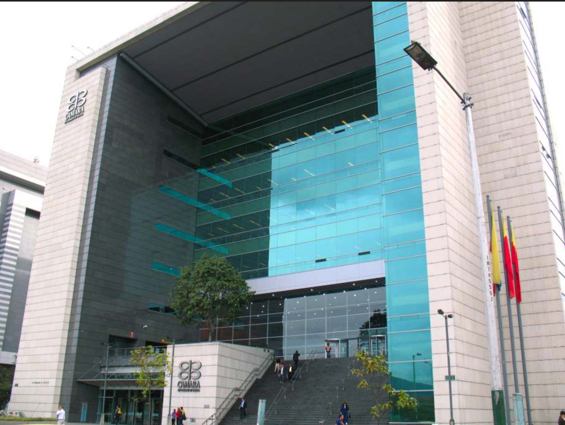
Centro Empresarial Salitre de la CCB