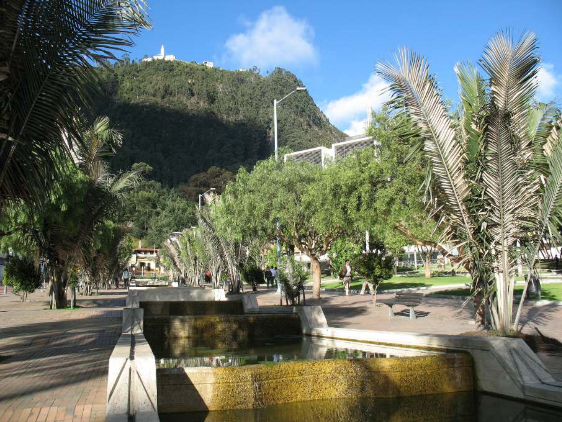
Eje Ambiental - Centro de Bogotá